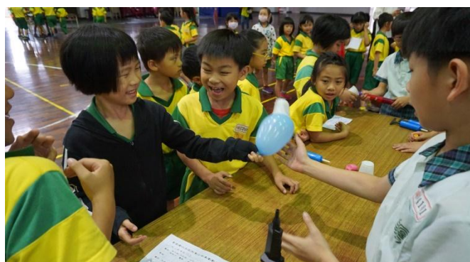
甩不了杯子——空氣壓力實驗