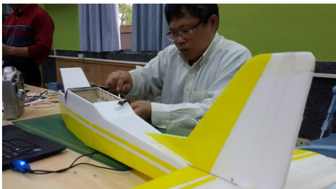
高師大自造教育輔導中心飛行自造研習