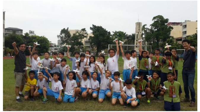
南郭國小-低碳能源科學動手自造 Maker 活動