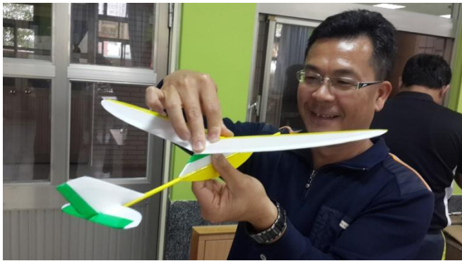
嘉義市自造教育示範中心飛行自造研習