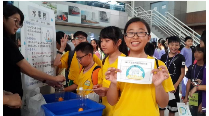
學生全民學科日、科學趴趴走 大家一起玩科學活動