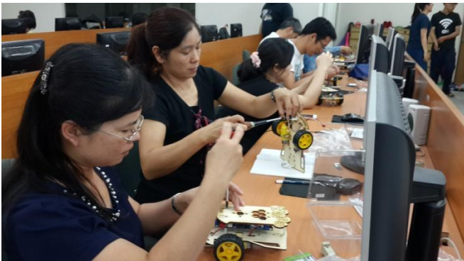
國立彰化師大學能源科技動手做 Brain GO 程式 智能車研習第二梯次