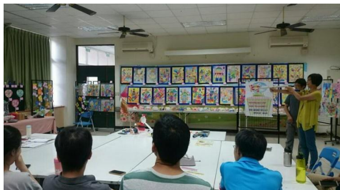
臺中市軍功國小创客教師空氣科學研習營