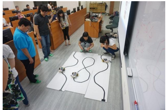
國立彰化師大學能源科技動手做 Brain GO 程式 智能車研習第一梯次