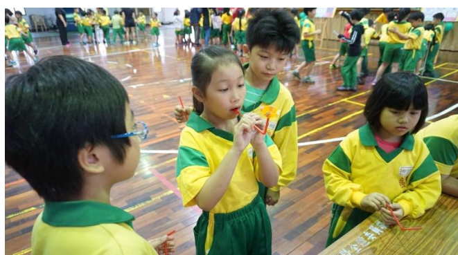
學生運用氣流自造旋轉陀螺