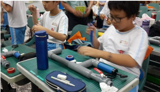
南郭國小-低碳能源科學動手自造 Maker 活動