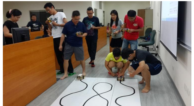
國立彰化師大學能源科技動手做 Brain GO 程式 智能車研習第二梯次