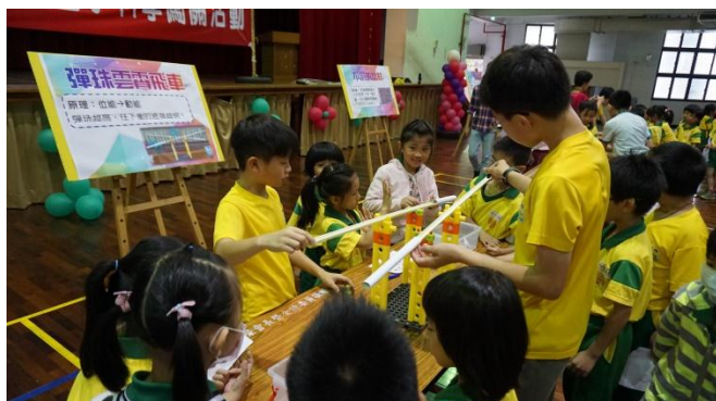
學生创客自造彈珠雲霄飛車