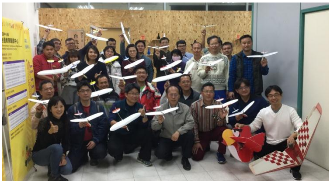
高師大自造教育輔導中心飛行自造研習