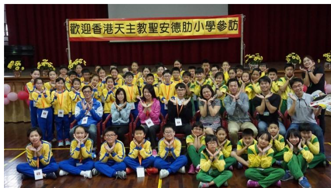
香港聖安德肋小學到校參訪創客教育