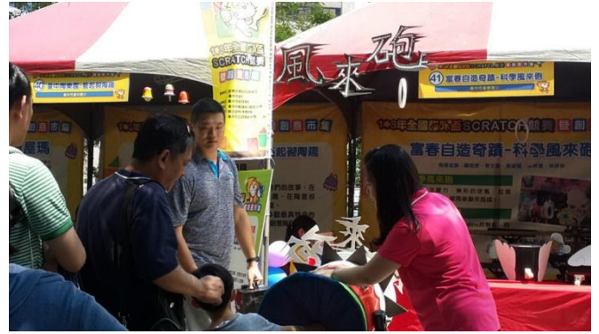
全國貓咪盃程式設計競賽及創意闖關市集