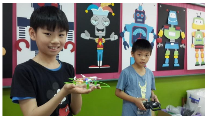
飛行社團 3D 列印微型四軸飛行器課程