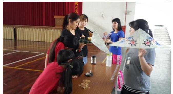
富春國小飛行創客 Maker 教師社群活動