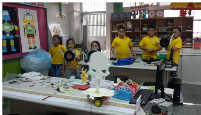
富春創客社團打造空氣砲+自動靶