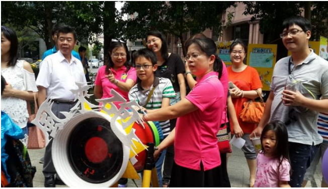
全國貓咪盃程式設計競賽及創意闖關市集