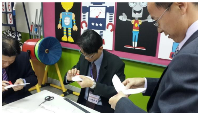
臺中市新任候用校長到校參訪創客教育飛行自造課程