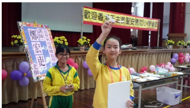
香港聖安德肋小學到校參訪創客飛行教育