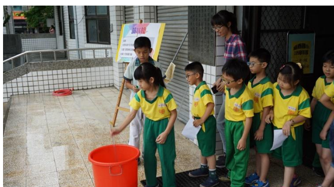
學生運用波以耳定律自製噴水槍