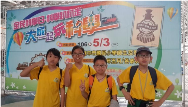
學生全民學科日、科學趴趴走 大家一起玩科學活動