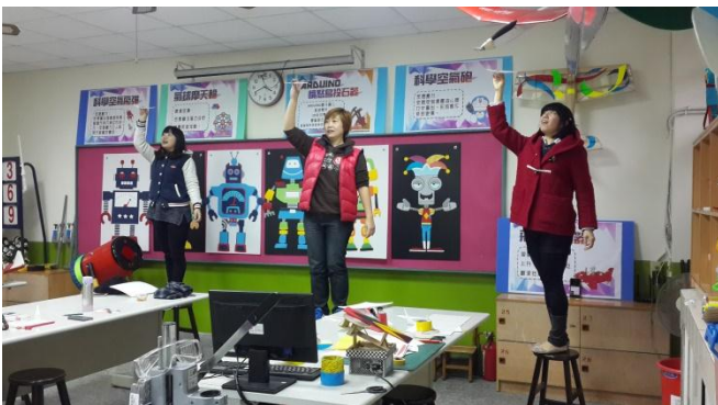
富春國小飛行創客 Maker 教師社群活動