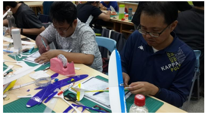
嘉義市自造教育示範中心飛行自造研習