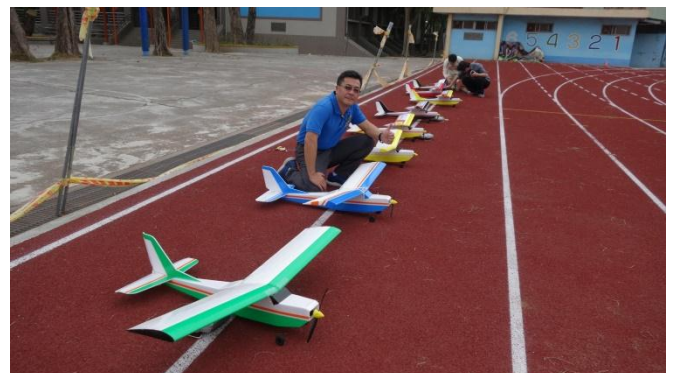
高師大自造教育輔導中心飛行自造研習