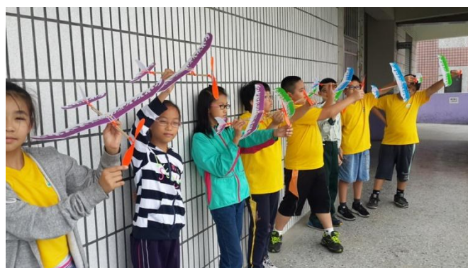
飛行社團動手自造螺旋槳飛機