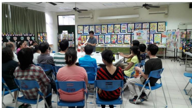
臺中市軍功國小创客教師空氣科學研習營