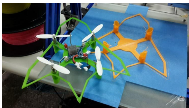
飛行社團 3D 列印微型四軸飛行器課程