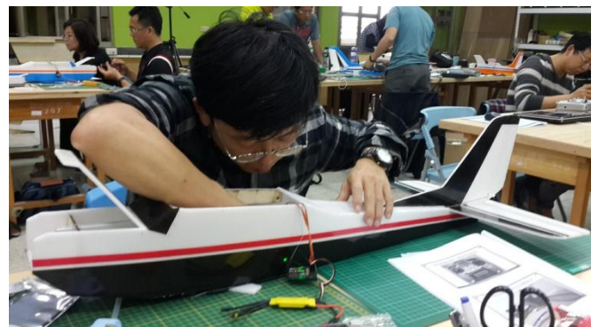
高師大自造教育輔導中心飛行自造研習