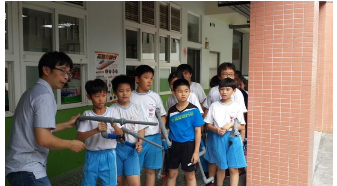
南郭國小-低碳能源科學動手自造 Maker 活動