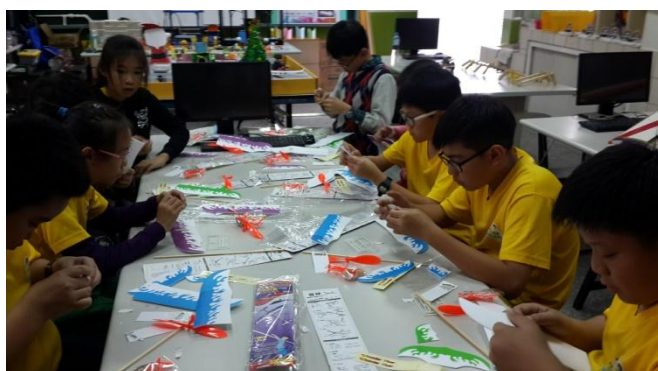
飛行社團動手自造螺旋槳飛機