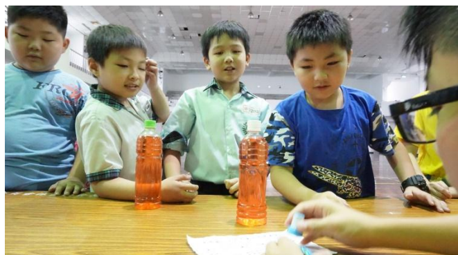
學生创客自造浮沈子實驗