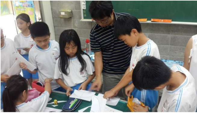
南郭國小-低碳能源科學動手自造 Maker 活動