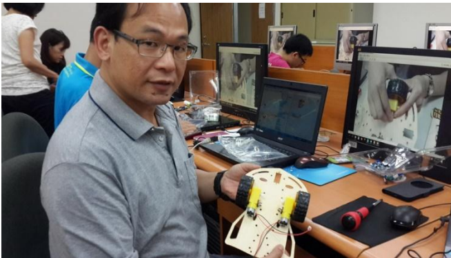
國立彰化師大學能源科技動手做 Brain GO 程式 智能車研習第一梯次