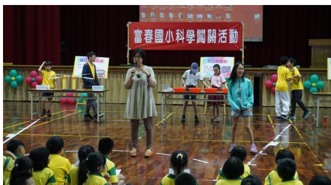
學生自主自造科學闖關活動