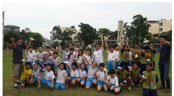
南郭國小-低碳能源科學動手自造手擲機活動