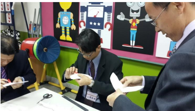
臺中市新任候用校長到校參訪創客教育飛行自 造課程