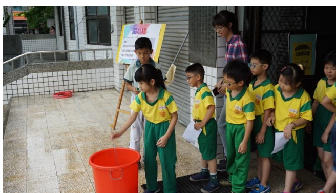
學生運用波以耳定律自製噴水槍