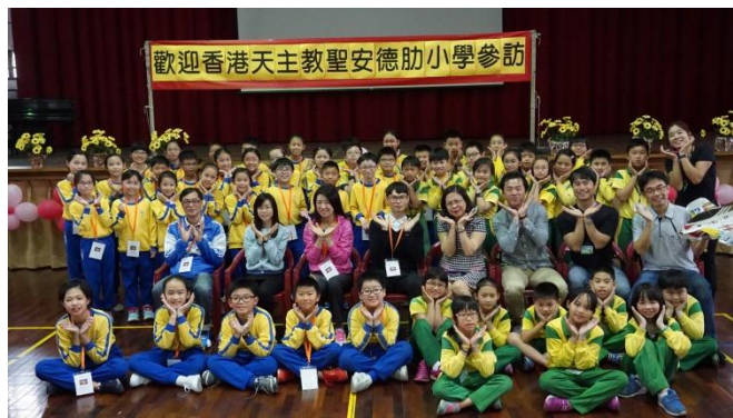
香港聖安德肋小學到校參訪創客飛行教育