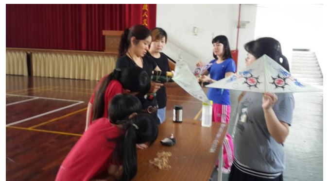
富春國小飛行創客 Maker 教師社群活動