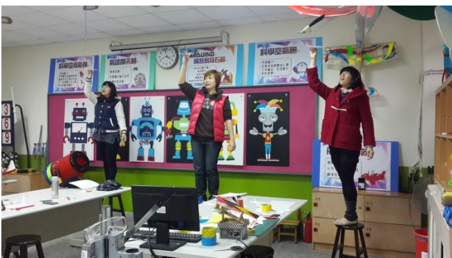
富春國小飛行創客 Maker 教師社群活動