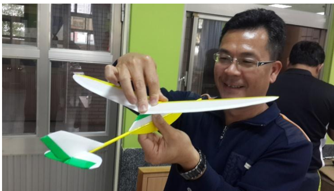
嘉義市自造教育示範中心飛行自造研習