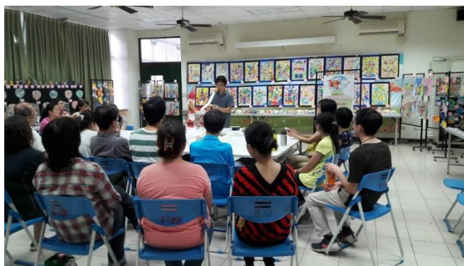
臺中市軍功國小創客教師空氣科學研習營