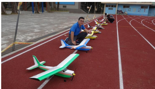
高師大自造教育輔導中心飛行自造研習