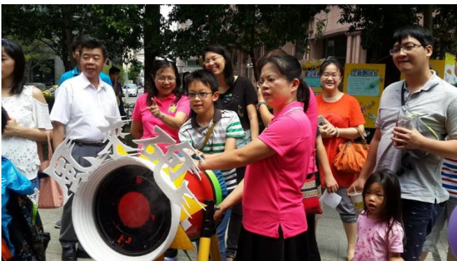
全國貓咪盃程式設計競賽及創意闖關市集