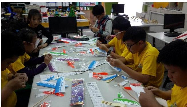
飛行社團動手自造螺旋槳飛機