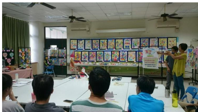
臺中市軍功國小創客教師空氣科學研習營