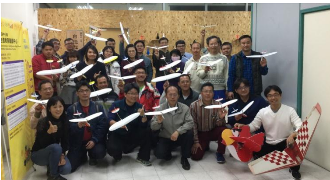
高師大自造教育輔導中心飛行自造研習