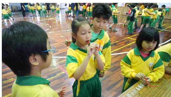
學生運用氣流自造旋轉陀螺