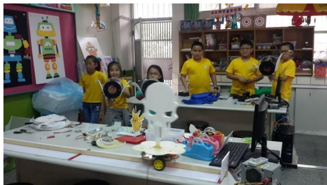
富春創客社團打造空氣砲+自動靶