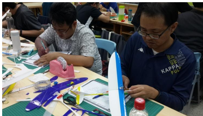
嘉義市自造教育示範中心飛行自造研習