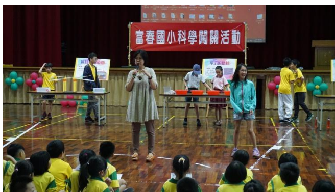
學生自主自造、空氣科學闖關活動