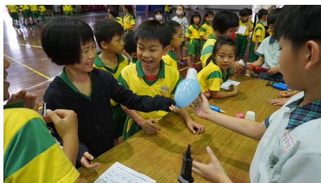
甩不了杯子--空氣壓力實驗