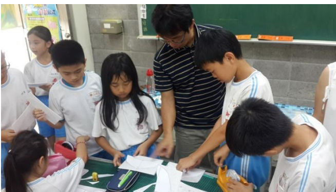
南郭國小-低碳能源科學動手自造滑翔機活動