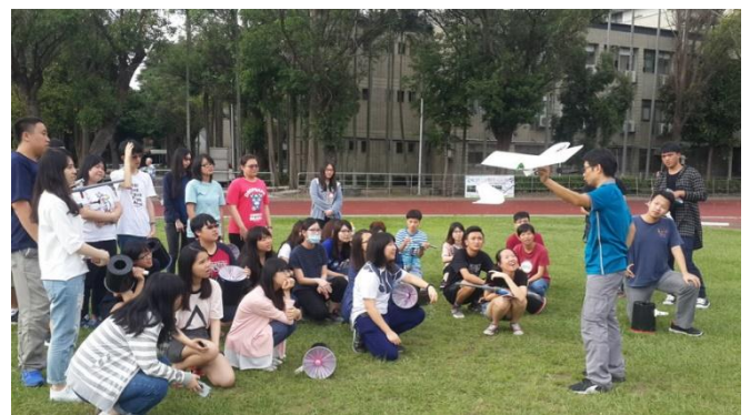
國立清華大學教育學院師培中心學生空氣科學 動手做研習