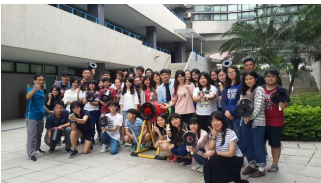
國立清華大學教育學院師培中心學生空氣科學 動手做研習