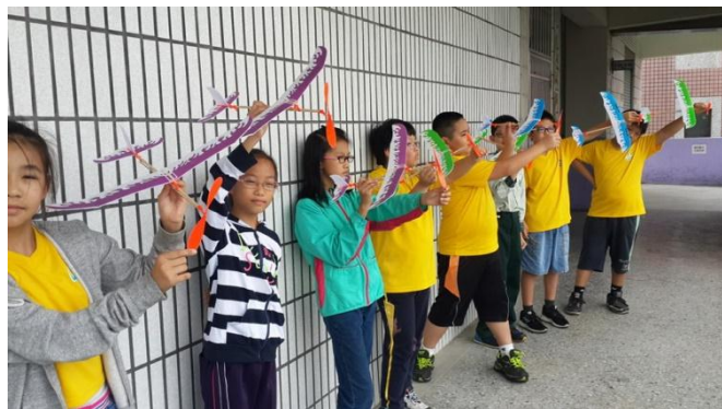
飛行社團動手自造螺旋槳飛機