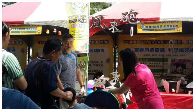
全國貓咪盃程式設計競賽及創意闖關市集