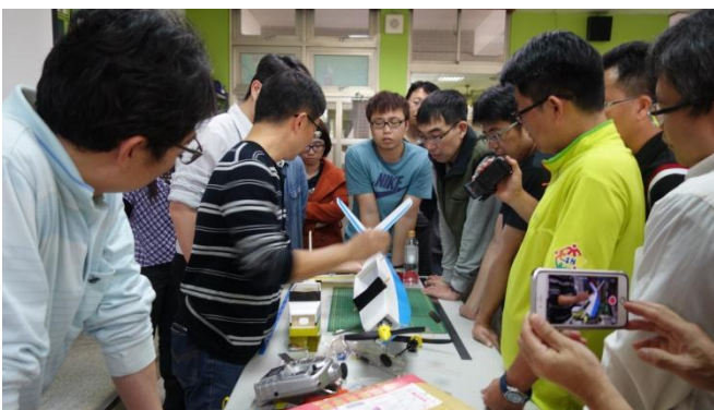
高師大自造教育輔導中心飛行自造研習