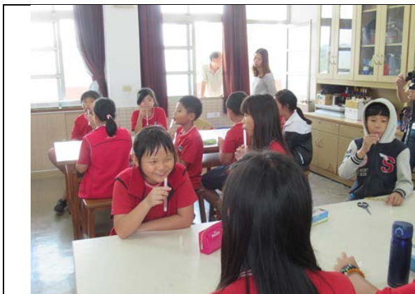
學生運用吸管探究空氣柱變化