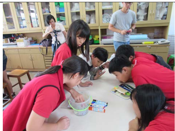
學生用水進行掉色實驗