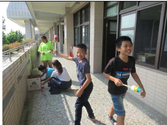
學生用噴漆繪製多多笛(永安)