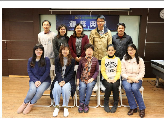
2019 科學教學活動教案徵選獲獎合照

5. 召開41次專業對談，共180人次參加，參加人員包括行政、課任、級任，及校外5位教師，及臺中市自然輔導團召集人及副召集人，將科教專案成果分享於永安、龍山、及龍海國小，將成果廣度再增加。