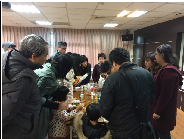
在新竹寰宇電台進行分享、討論及交流

4. 成員參加「2019科學教學活動教案徵選」，獲得第二名，團隊並於12/7在新竹寰宇電台進行分享、討論及交流。