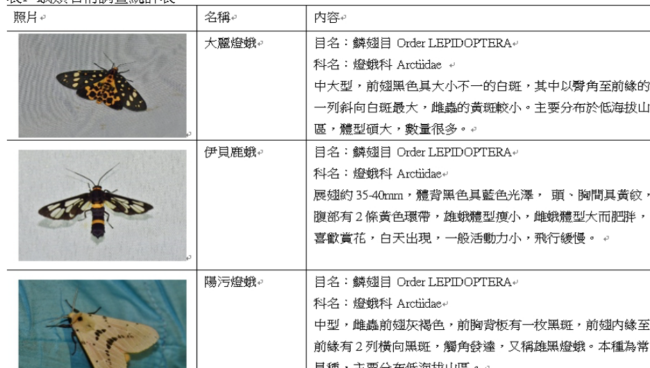
表1 蛾類名稱調查統計表 4)