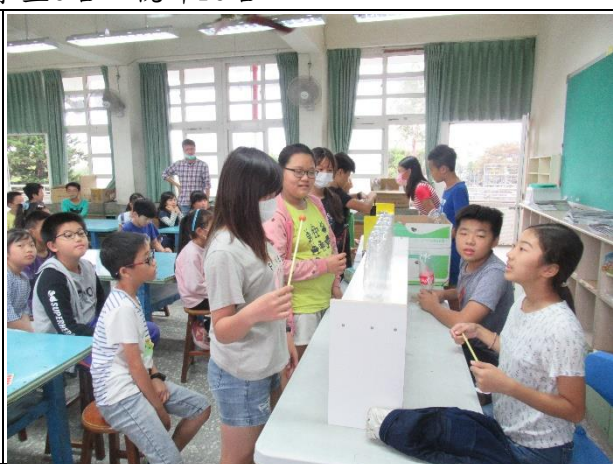
2020臺灣科學節校內預演