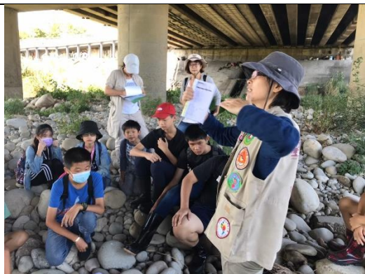
05 鳥類調查專家課程