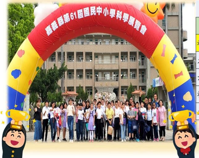
嘉義縣國民中小學科展歷年團體成績前五名一覽表

109年度、110年度和睦國小科學團隊參加 嘉義縣60屆、61屆科展 連續兩年榮獲國小團體組特優第一名