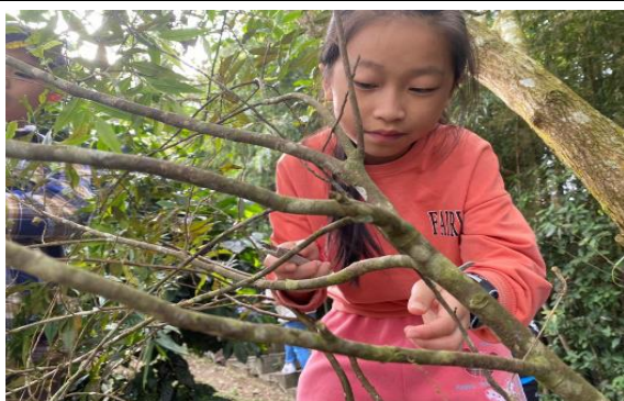
銳葉桫欏環狀剝皮