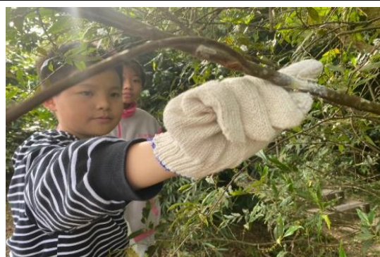
樹枝剝皮處塗抹發根粉