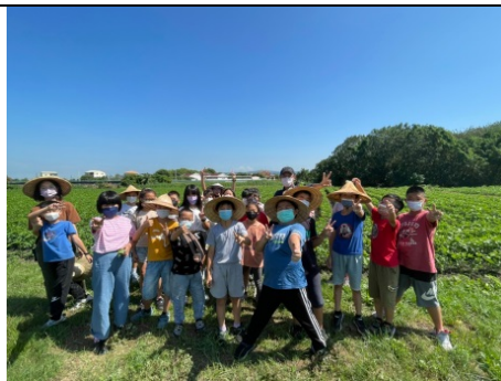
野外踏查~田野勤學耕作基地