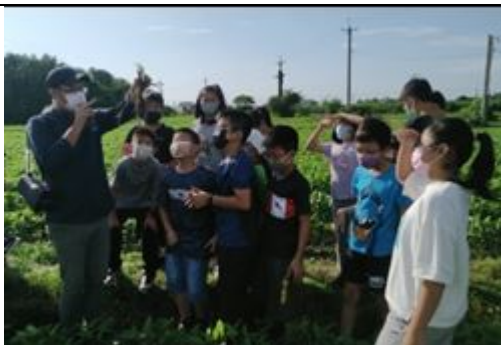
野外踏查~田野勤學耕作基地