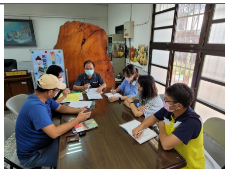
科學教育教師社群討論