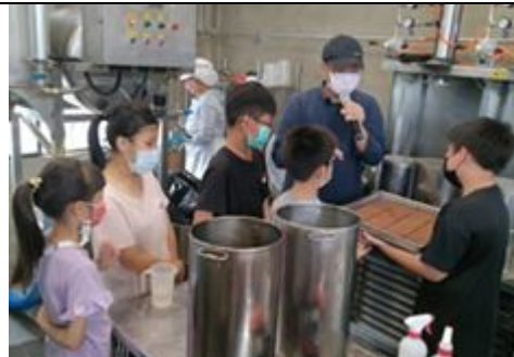
豆漿工廠解說與參觀