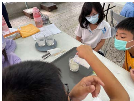
科學實驗~沖製三度(角度、溫度、濃度)