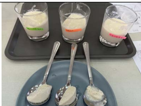
科學實驗~沖製三度(角度、溫度、濃度)