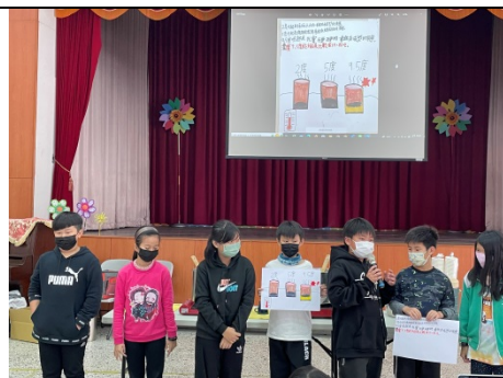
發表實驗結果與心得、感想

四、科學教育教師社群運作：成立科學教育教師社群，定期召開會社群會議，討論與修正實驗影響因素。(隔週一下午)