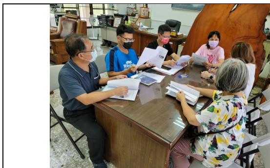
科學教育教師社群討論

四、科學教育教師社群運作：成立科學教育教師社群，定期召開會社群會議，討論與修正實驗影響因素。(隔週一下午)