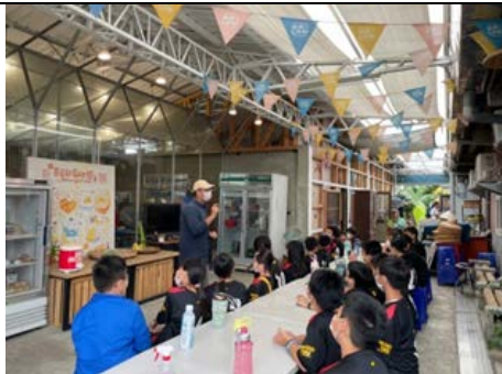
豆漿工廠解說與參觀