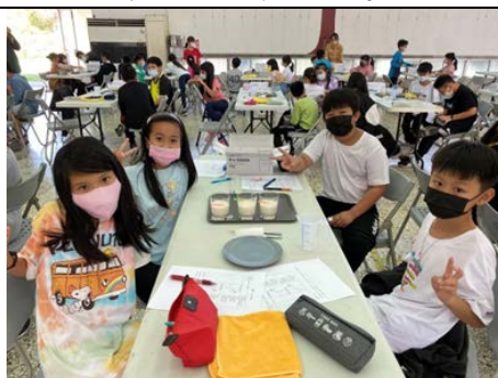
科學實驗~沖製三度(角度、溫度、濃度)