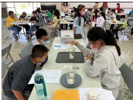
科學實驗~沖製三度(角度、溫度、濃度)