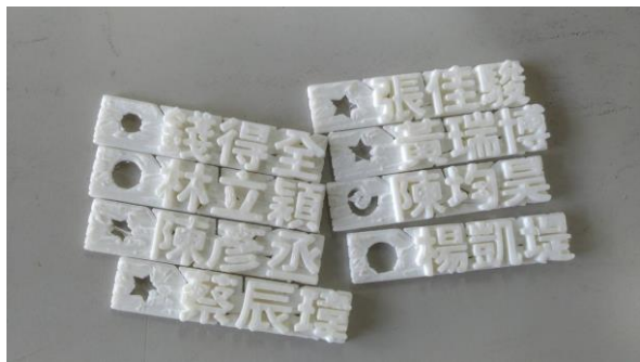
學生的第一件作品名字鑰匙圈(半成品)