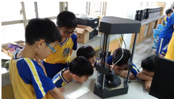
學生用資訊課學習 3D 列印的課程