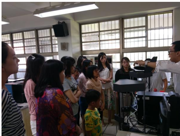
教師進行 3D 列印與雷射雕刻增能研習