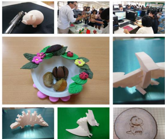
教師 3D 列印及雷射雕刻作品