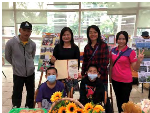
食農教育推展小組