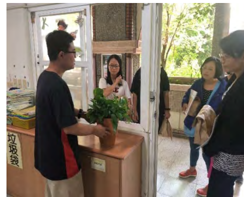
環保金爐及節能屋介紹