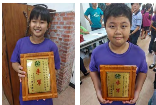
榮獲全縣四健會農務組第三名