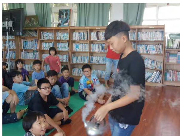
學生拿著裝有液態氮的水壺體驗阿拉伯神燈的景象。