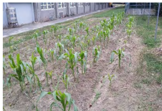
目前玉米田生長高度