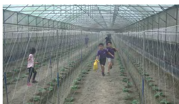
學生暢遊網室小黃瓜園