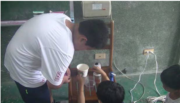
了解水的虹吸現象