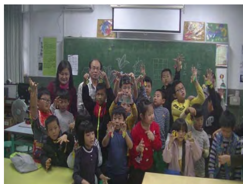
化腐朽為神奇-環境美學的創客