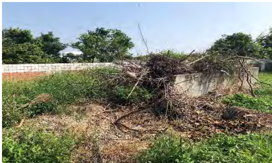
整治前的斷裂落葉堆肥場