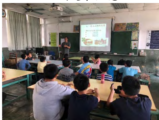
認識有機栽培的重要