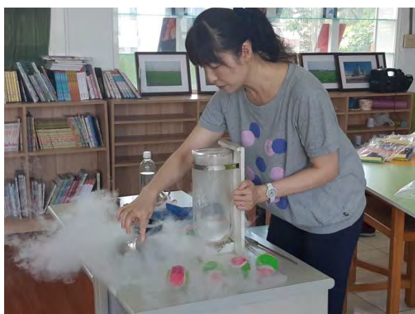
液態氮的體驗與實作說明