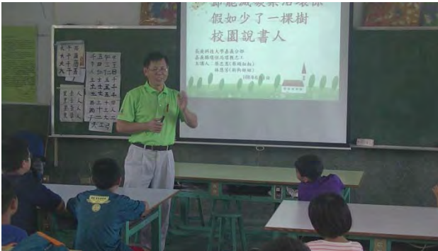
環保局沈先生教導環保概念與環境守護行動實踐的重要