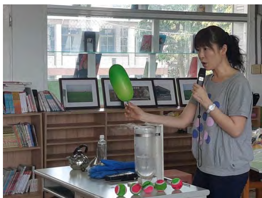
氣球經過液態氮縮小