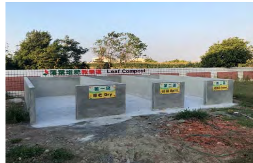
重新整建好的落葉堆肥場