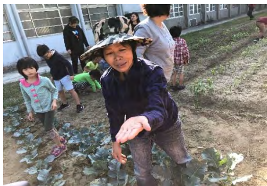
家長協助病蟲害防治