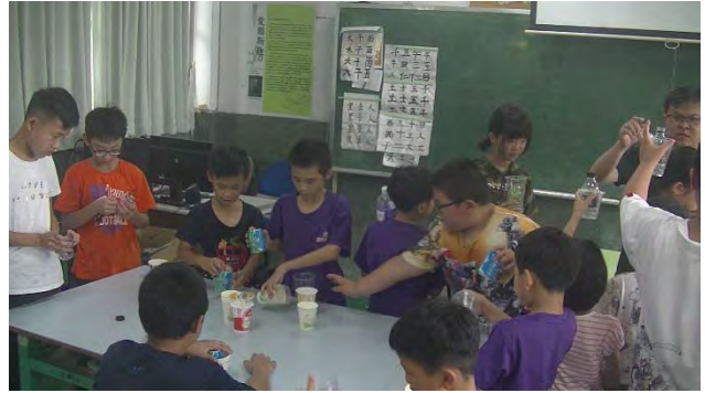
學生從做中學中了解環保的創意發想