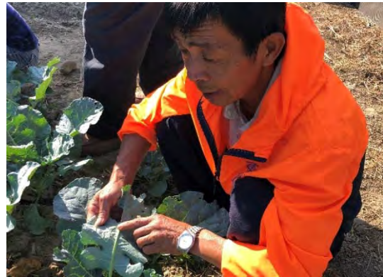
社區專家到校指導栽種青花菜、玉米、小蕃茄要領