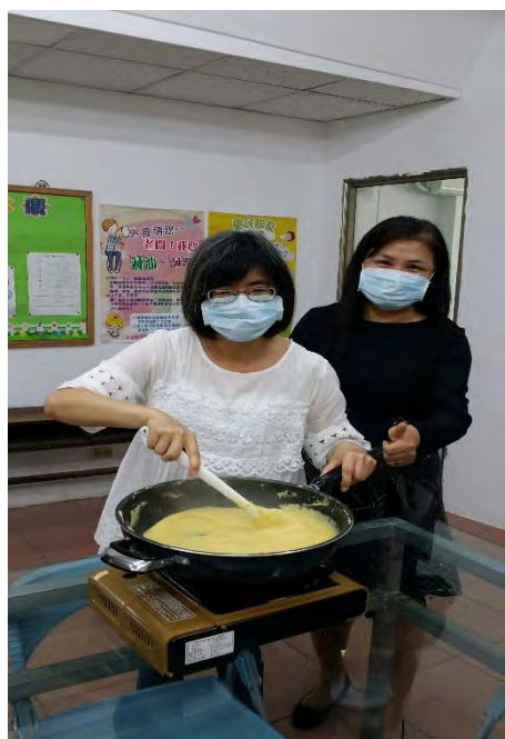
彬純師和瑤卿師邁力攪拌