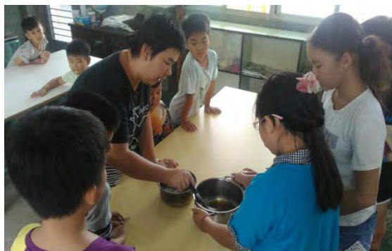
玉米手工皂科學營，讓學生了解玉米的養生功能