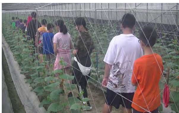
社區小黃瓜網室栽培體驗