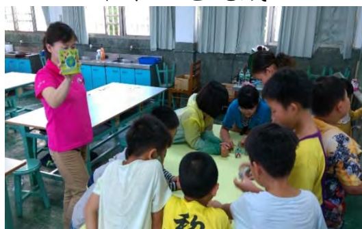
環保局科長為學生建構環保綠生活概念與行動