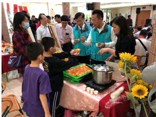
縣長及處長到場品嚐