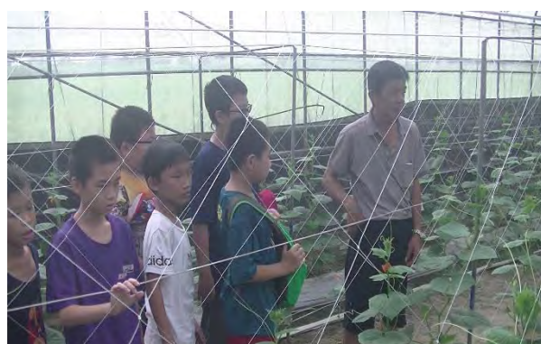
村長介紹網室種植方法