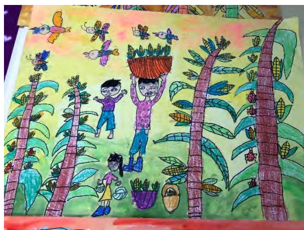
開心農場學生畫作