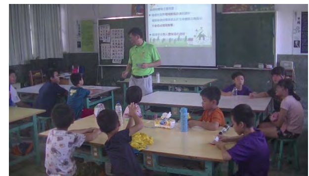
從認識環保標章啟動學生節能減碳行動