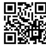
美食交流技術協會