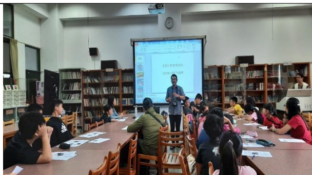
03 戶外教育專家課程