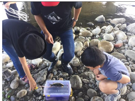
06 紀錄早溪魚類圖鑑