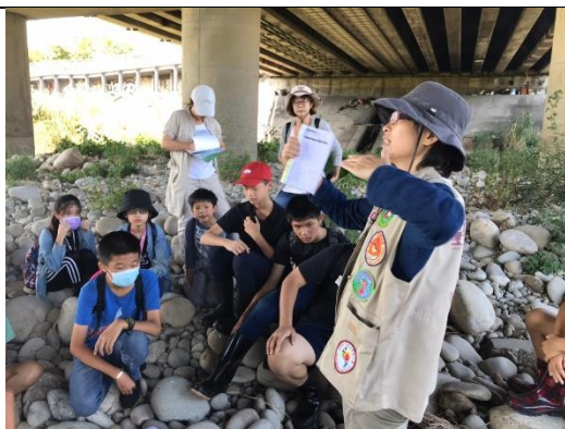
05 鳥類調查專家課程