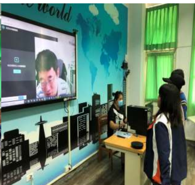
定期分組學生專題課程視訊會議討論