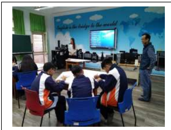
進行課程教學前測