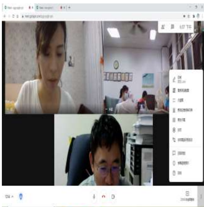
與南台科大教授合作進行教師視訊討論

目前規劃五~九年級以 PBL 專題導向的教學模式，結合資訊科技結合語文領域與實驗課程時實施教學。在教學活動中，學習的主角是學生，而教師擔任學習的推動者，設計學生須達成的任務行動，引導學生做小組的探究學習，學生在實際情境中學習，更能引發學習興趣。