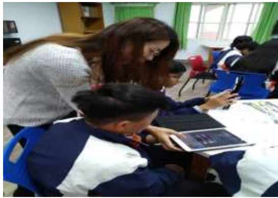
協同教學老師協助指導