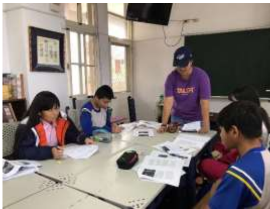
進行課程教學說明