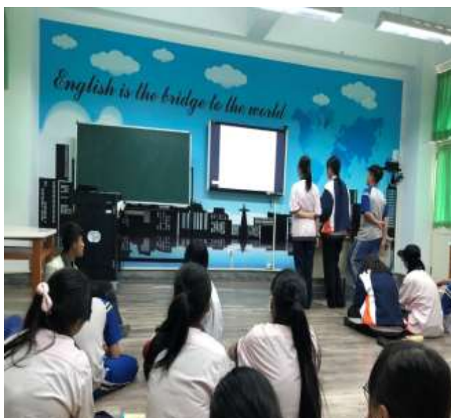
與南台科大教授合作進行學生視訊討論