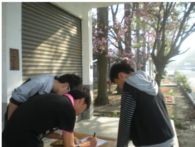
學生簽到領取上課講義